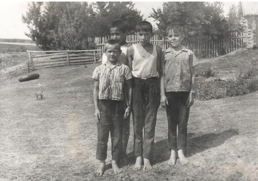
Яланаяклы балачак. 1975 нче елның жәе.

Әсгать абый, тормыш иптәше Гүзәлия апа белән өч бала тәрбияләп үстерделәр. Барча балалары да мәктәпнең